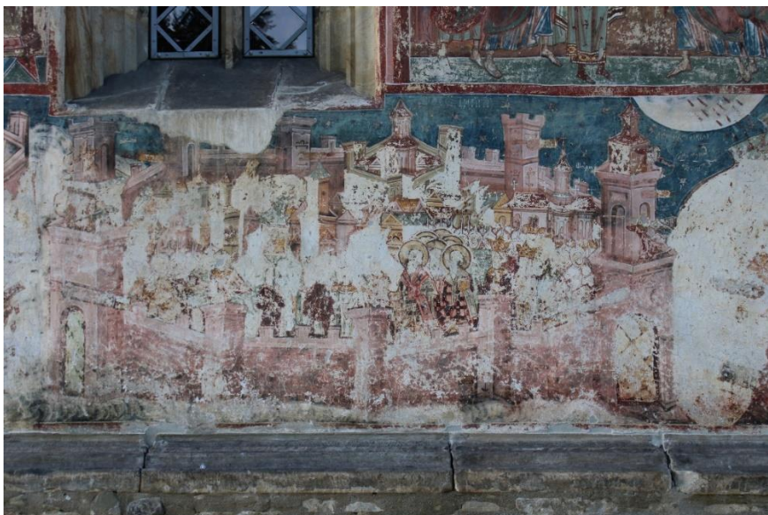
Fig. 5. Reprezentarea cetății Constantinopolului, 1535, în pictura murală exterioară a Bisericii Adormirea Maicii Domnului de la Mănăstirea Humor.