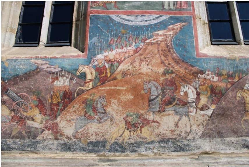
Fig. 4. Reprezentarea armatei asediatoare, 1537, în pictura murală exterioară a Bisericii Bunei Vestiri de la Mănăstirea Moldovița.