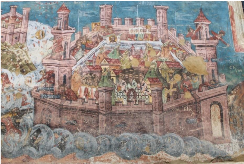
Fig. 2. Cetatea Constantinopol, 1537, în pictura murală exterioară a Bisericii Bunei Vestiri de la Mănăstirea Moldovița.