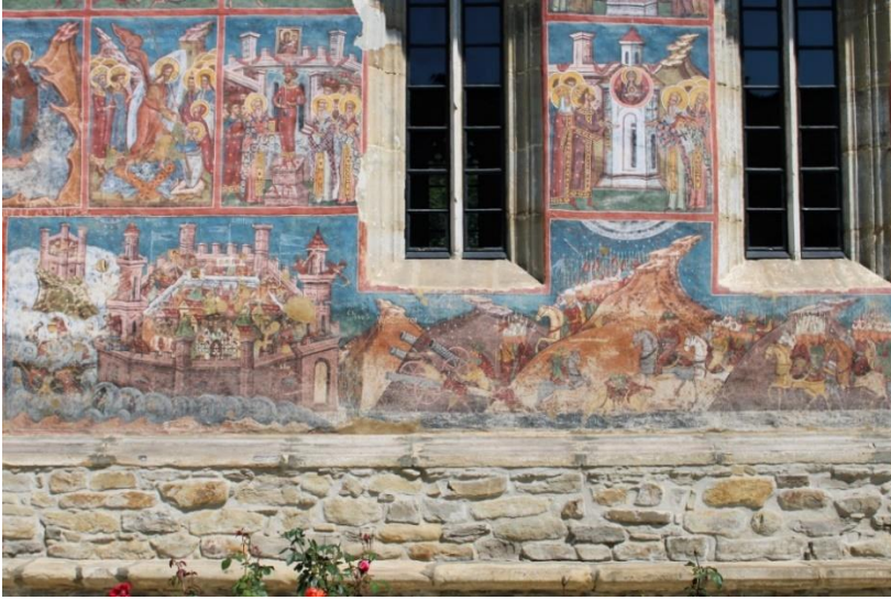
Fig. 1. Asediul Constantinopolului, 1537, în pictura murală exterioară a Bisericii Bunei Vestiri de la Mănăstirea Moldovița.