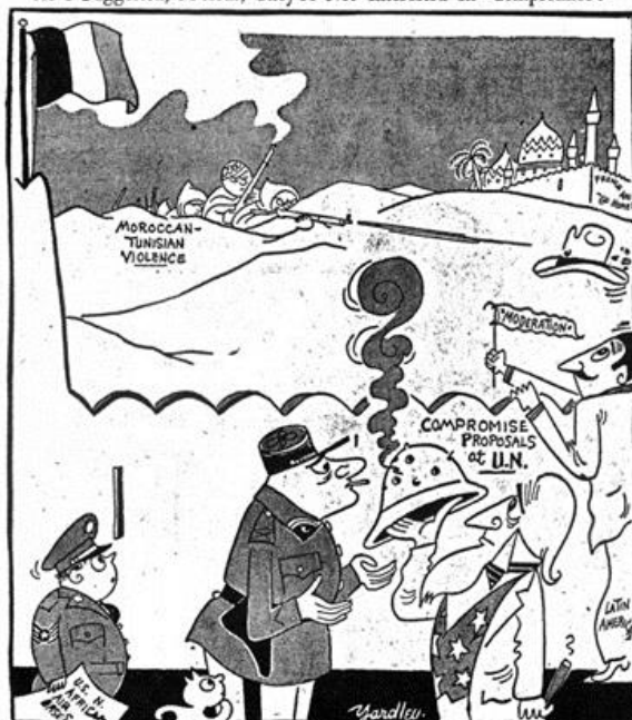
The Baltimore Sun , 11 December 1952, copy held in États-Unis, vol. 346, MAE.

“As I Suggested, M’sieurs, They’re Not Interested In ‘Compromise!’”