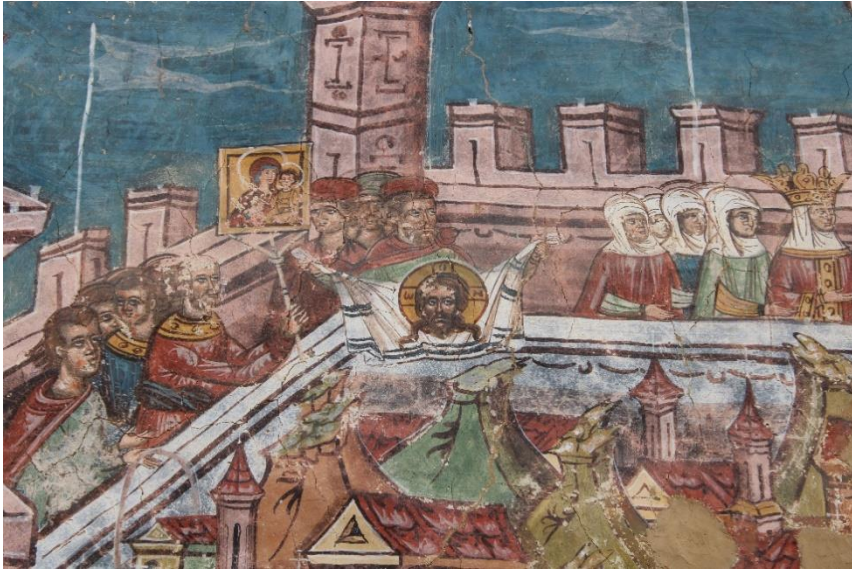
Fig. 3. Reprezentarea chipului lui Hristos și Icoana Hodegetriei, 1537, în pictura murală exterioară a Bisericii Bunei Vestiri de la Mănăstirea Moldovița.