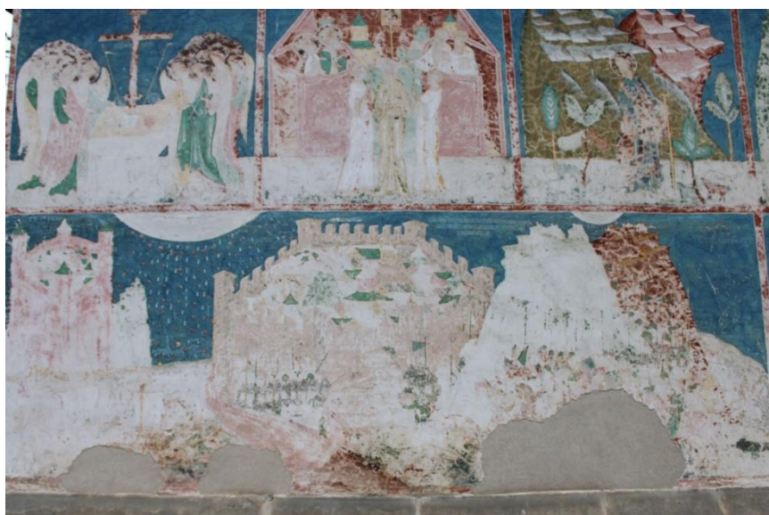
Fig. 5. Reprezentarea cetății Constantinopolului, 1540, în pictura murală exterioară a Bisericii Sfântului Ioan Botezătorul din satul Arbore