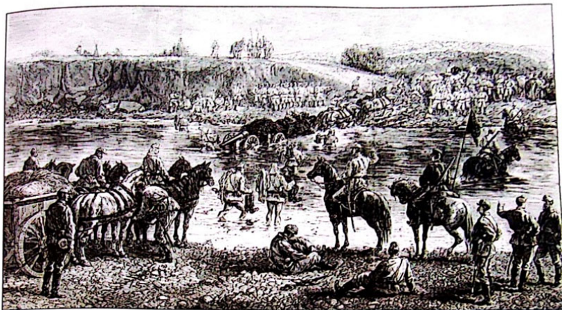
Trecerea podului peste Dunăre, de la Brăila la Ghecet, în prezența țarului pe 23 iunie 1877, desen de Dick de Lonlay, „Le Monde Illustré” nr. 1056/7 iulie 1877.