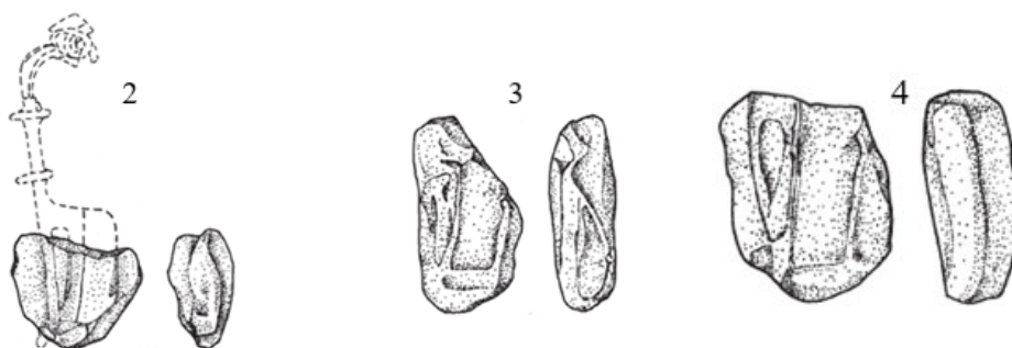
Figurile 2-4: fragmente de tipare pentru fibulele norico-pannonice cu două nodozități (sursa: Sorin Cociș, The Brooch Workshops , p. 185, pl. 69, fig. 695-697)