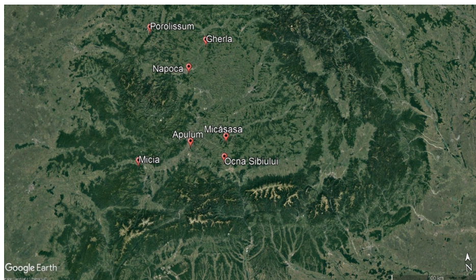
Figura 1: Posibile centre de producție de fibule norico-pannonice