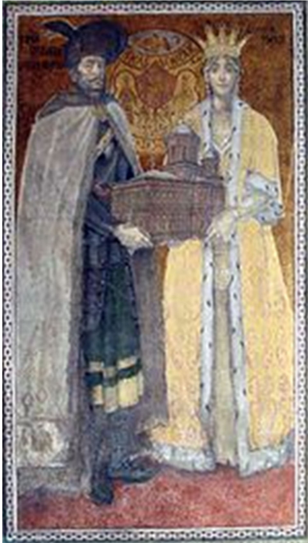
Fig. 1. Tabloul votiv al lui Mihai Viteazul din Mănăstirea Mihai Vodă din București.